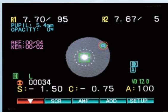
高速他覚屈折測定