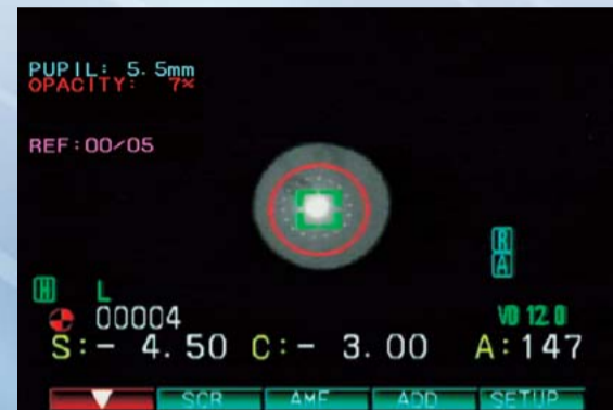
中間透光体混濁自動検知

急速なLCD機器の発達や3D機器の普及に伴う眼精疲労、調節トラブルに対応。 さらに、屈折測定中に中間透光体混濁をもとらえる、 最も新しい眼負荷調節・屈折測定一体型!